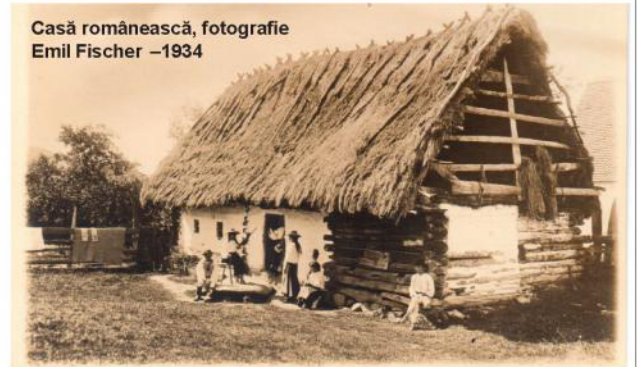
Casă românească – 1934