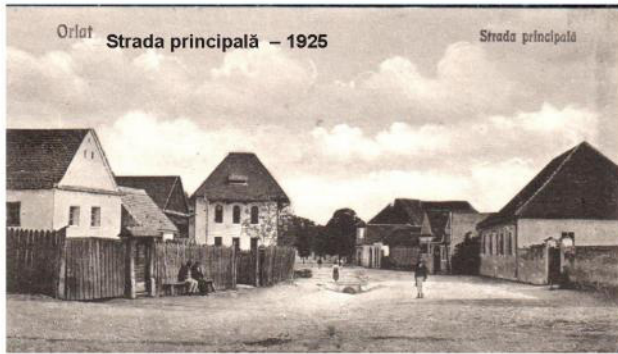
Orlat Strada principală – 1925