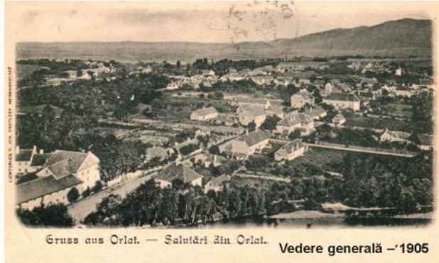
Gruss aus Orlat. — Salutări din Orlat. Vedere generală – 1905