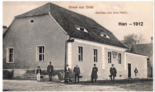
Gruss aus Orlat.