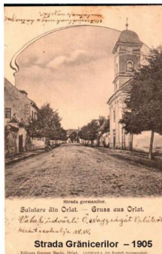
Strada germanilor. Salutări din Orlat. — Gruss aus Orlat. Platz in Orlat. Orlagraben Orlat. Kriegsdenkmal 1916.