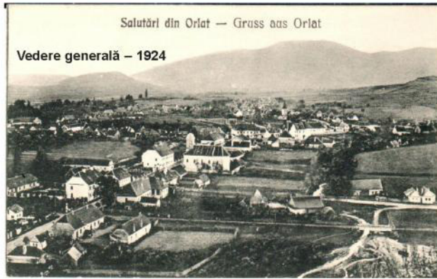
Salutări din Orlat — Gruss aus Orlat