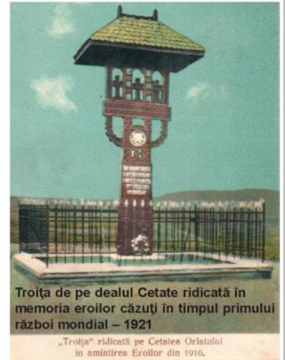
Troița de pe dealul Cetate ridicată în memoria eroilor căzuți în timpul primului război mondial – 1921