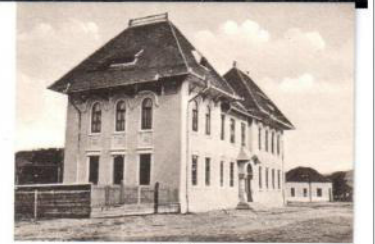
Școala Salutări din Orlat