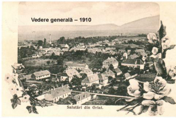
Vedere generală – 1910