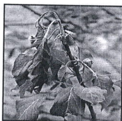
Atac pe vârful de creștere