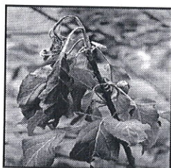
Atac pe vârful de creștere